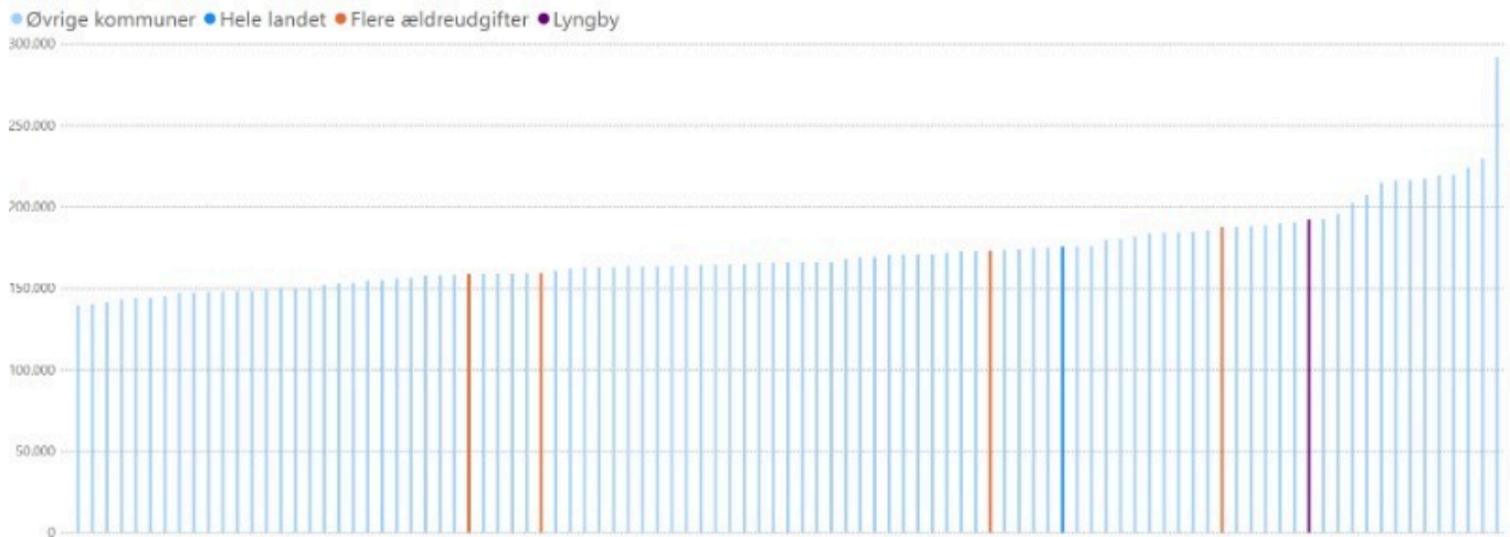
Figur 1: Udgift pr. 80+-årig. 2024

På landsplan blev der brugt ca. 175.000 kr. pr. 80+-årige. Lyngby-Taarbæk kommune havde udgifter svarende til ca. 192.000 kr. pr. 80+-årig. Ældresagen fremhæver, at der kun er fire kommuner, der har brugt flere penge pr. 80+-årige - i 2024. Ingen af de fire kommunerne har et højere udgiftsniveau end Lyngby-Taarbæk kommune og blot én af kommunerne har et udgiftsniveau, der er højere end landsgennemsnittet. Der er således tale om kommuner, der kommer fra et lavere udgangspunkt.