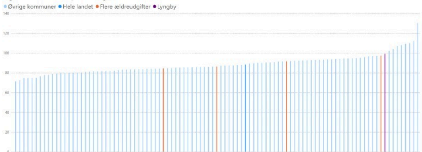
Figur 2: Indikator for prioritering af ældreområdet, 2024

Figuren viser, at der blot er otte kommuner, der har en indikator over 100 - dvs. at der er otte kommuner, hvor andelen af udgifter til ældreområdet ud af de samlede udgifter er steget siden 2018. Det bemærkes, at den udvikling indikatoren beskriver, alene kan være udtryk for, at der bruges flere penge på andre områder (fx specialområderne eller stigende børnetal og deraf afledte udgifter til skole og daginstitutioner). Den fortæller alene, at det for 90 kommuner er gældende, at ældreudgifternes andel af de samlede udgifter er faldende.