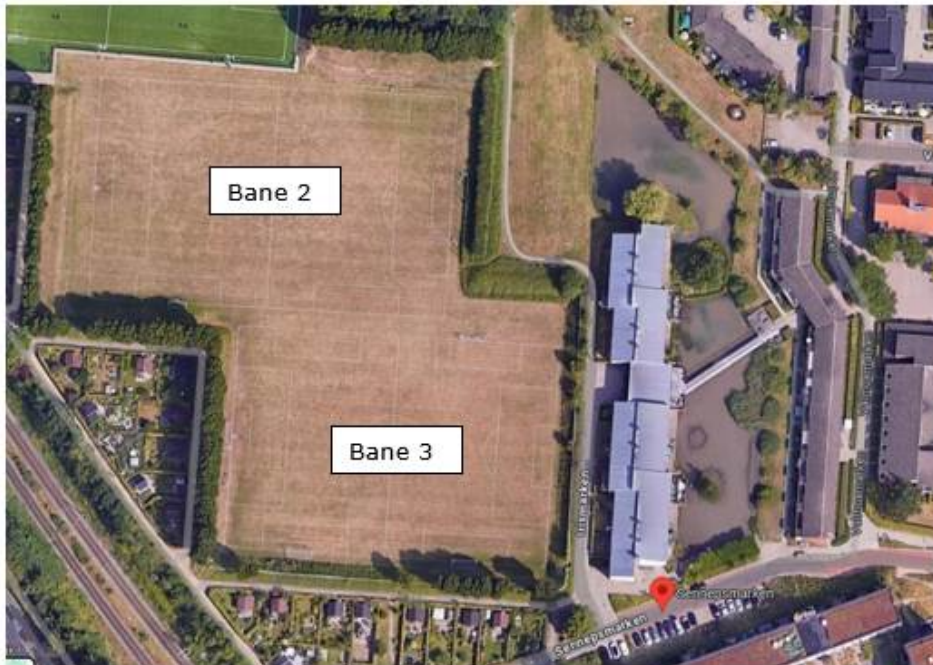
Figur 1 Luftfoto af boldbane 2 og 3 samt søen ved Sennepsmarken

Efter Kommunalbestyrelsens beslutning om placering af en kunstgræsbane på Virumgårds Jorder – på bane 2, jf. kort nedenfor - arbejder forvaltningen og ekstern rådgiver videre med disponering og projektering af kunstgræsbanen. Forvaltningen er i dialog med Lyngby-Taarbæk Forsyning for at sammentænke behov og begrænsninger for en kunstgræsbane og regnvandsforsinkelsesbassin samt konsekvenserne heraf.